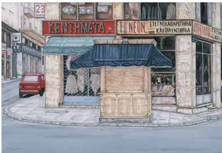
Ακρυλικό σε μουσαμά 55 εκ. x 38 εκ., 2002