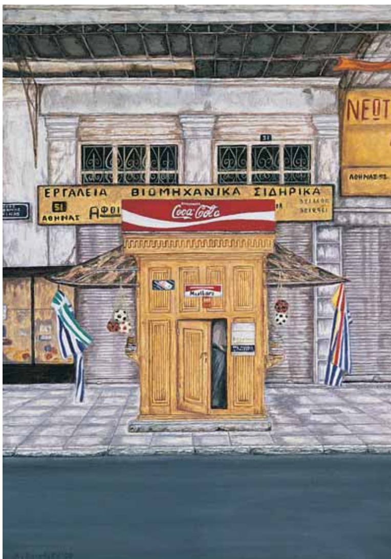
Ακρυλικό σε μουσαμά 38 εκ. x 55 εκ., 1997