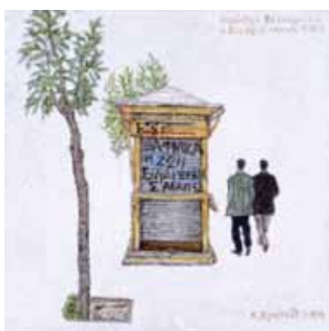
Ακρυλικό σε μουσαμά 20 εκ. x 20 εκ., 2004