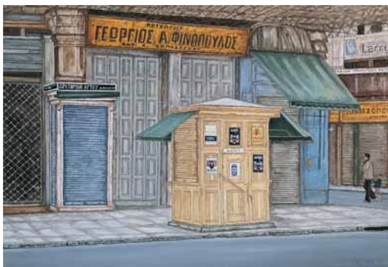
Ακρυλικό σε μουσαμά 55 εκ. x 38 εκ., 2001