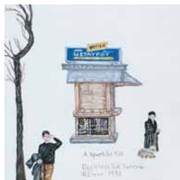
Ακρυλικό σε μουσαμά 16 εκ. x 16 εκ. 2003