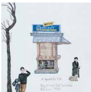
Ακρυλικό σε μουσαμά 16 εκ. x 16 εκ., 2003