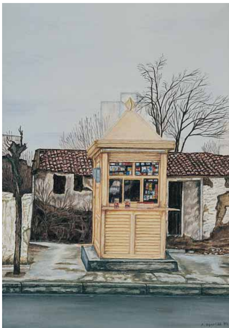
Αγρυλικό σε μουσαμά 38 εκ. x 55 εκ., 1994