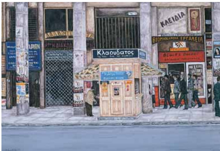
Ακρυλικό σε μουσαμά 55 εκ. x 38 εκ., 2002

Η έκθεση αυτή έχει θέμα τα Περίπτερα της Ελλάδας.