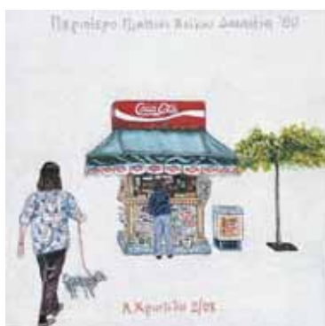
Ακρυλικό σε μουσαμά 16 εκ. x 16 εκ., 2003