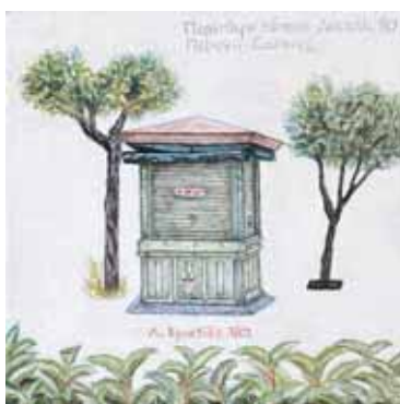
Ακρυλικό σε μουσαμά 16 εκ. x 16 εκ., 2003