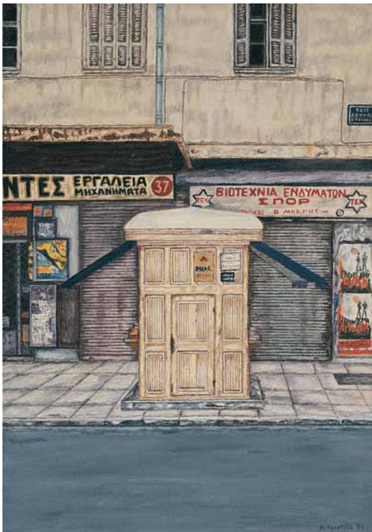
Ακρυλικό σε μουσαμά 38 εκ. x 55 εκ., 1999