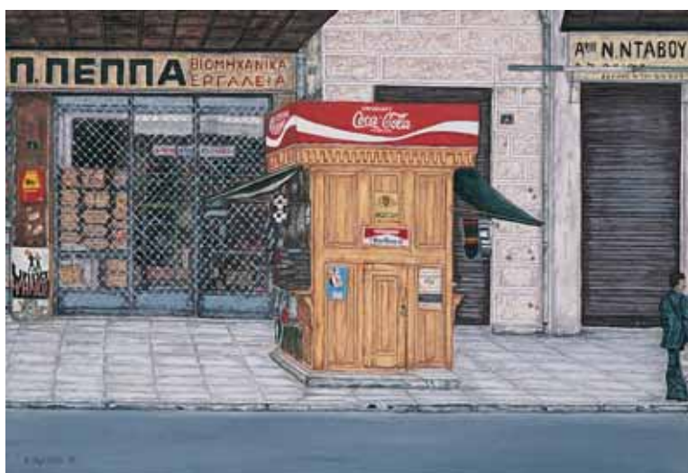
Ακρυλικό σε μουσαμά 55 εκ. x 38 εκ., 2002