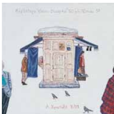
Ακρυλικό σε μουσαμά 16 εκ. x 16 εκ. 2003